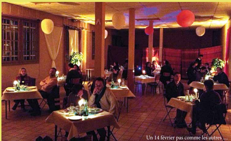
Un 14 février pas comme les autres ....

« Saveurs dans les verres, les assiettes ... et saveurs dans les échanges des convives.