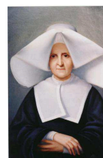
Bse Rosalie Rendu Fille de la Charité 1786-1856

Mettons nous en présence de la Parole de Dieu