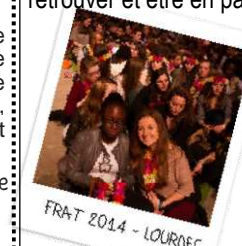
FRAT 2014 - LOURDES